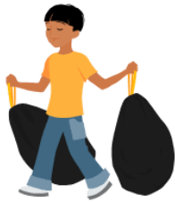
sacar la basura