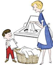
lavar la ropa