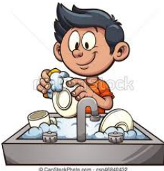
lavar los platos