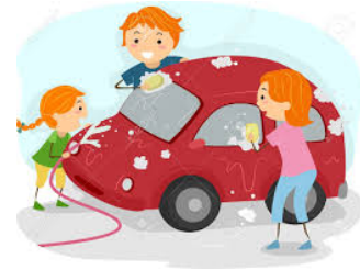
lavar el coche (carro)