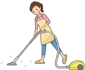
pasar la aspiradora