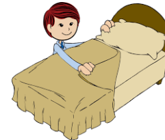
hacer la cama